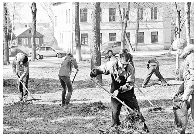
Осенний субботник в сквере Победы

Михаил ВАСИЛЬЕВ.