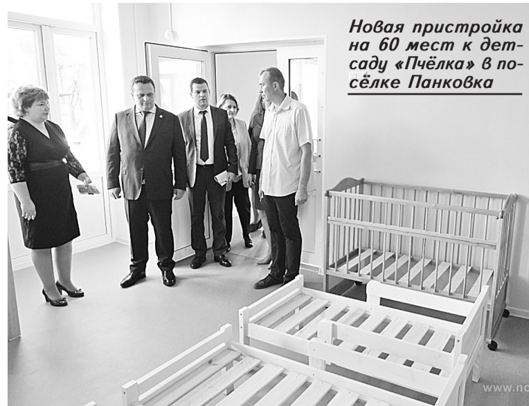
Новая пристройка на 60 мест к детскому саду «Пчёлка» в посёлке Панковка

всего, в транспортной и торговой отраслях ужесточить требования к масочному режиму. Перевозка людей должна быть только в масках, пассажиры также должны их использовать. То же самое касается и обслуживания граждан в магазинах и пунктах общественного питания. Органы исполнительной власти, совместно с УМВД и Роспотребнадзором, прошу перейти к режиму постоянного контро-